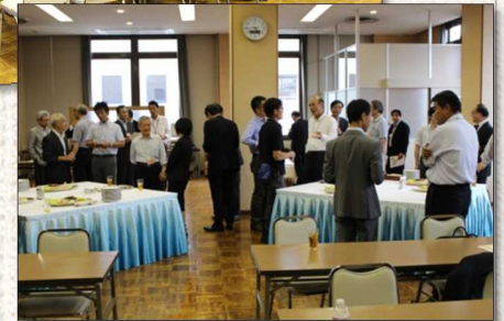
▲新産業創出研究会の例会の様子