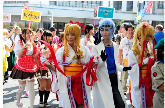
△昨年度のコスプレパレードの様子