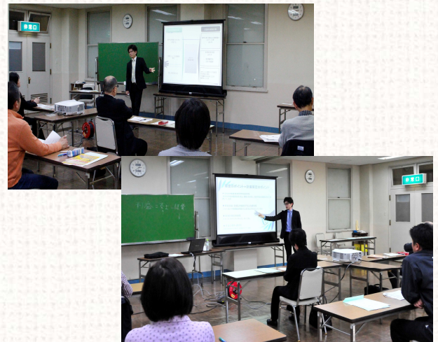
▲セミナー両日の様子

補助金制度に対する考え方や活用するにあたっての心構えについて話があり、その後、現在公募中の「小規模事業者持続化補助金」の申請書を参考に申請書作成のポイントについて解説を行った。