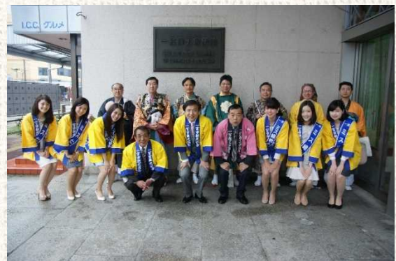
△七福神パレード出発前の一コマ

毎年春に開催される一宮桜まつりのメイン行事である七福神パレードが、4月5日、一宮市内で行われた。