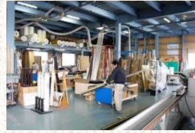
△長尺の部品の加工まで 可能とする広い空間

「スクーバン」についてはこちらから⇒ http://www.biso2000.com/cordial/cordial2010/bousai/index.html