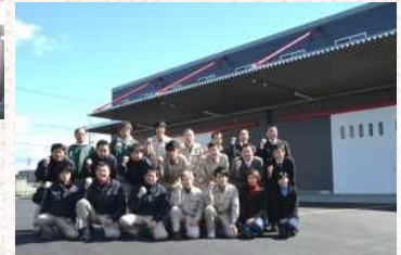
▽本社第2工場と本社社員

ことは、社員に強い負担を強いることとなる。そうではなくて、付加価値の高い商品を作り、官公庁の看板というニッチな市場の中で他社と差別化し、高付加価値を求めることで、生き残りを図った。