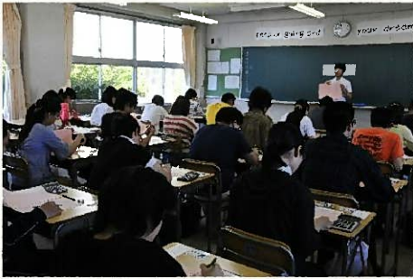
△第 131 回簿記検定試験の様子

一宮商工会議所は、今年度最初となる日商簿記能力検定試験を 6 月 10 日、一宮商業高校で実施した。