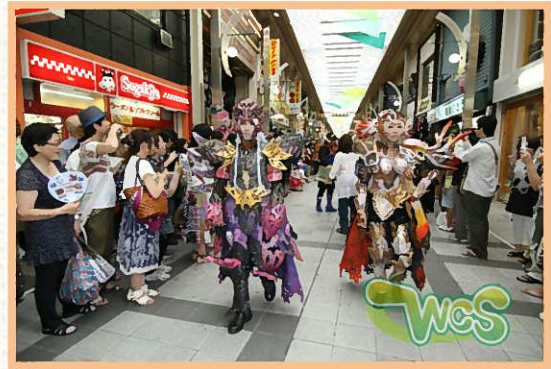
大須商店街で行われたパレードの様子（2011）

当日は世界各国から選抜されたコスプレイヤーと一般募集を行った300名のコスプレイヤーが商店街を練り歩き、真澄田神社にて記念撮影を行います。パレード終了後には、盆踊りのステージに会場を移し、ステージパフォーマンスで会場を華やかに魅了します。