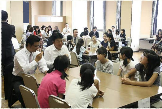
△「ジュニアエコノミースクール」ファーストセミナーの様子

6月3日、一宮商工会議所青年部は本所にて「ジュニアエコノミースクール」のファーストセミナーを開催した。