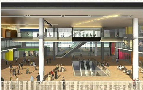
△会場となる駅前ビル 3 階シビックテラス (イメージ)

今年度は、モーニングマップの作成や尾張一宮駅前ビル (通称 i-ビル) の竣工を祝い、「第 6 回モーニング博覧会」を同ビルで実施し、「モー1 (ワン) グランプリ」を決定する予定。