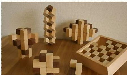
▲創造力を育む創作積木「双」(そう) 9個入 4,500円

当社は、平成23年1月に創業した木曾檜を素材にした木製玩具の製造、販売を主に行う積木工場である。代表であり積木作家でもある春日井氏は、十数年来、エンジニアとして機械設計に携わるサラリーマンだった。そんな中、あるときドイツ製の木馬に接する機会に触れ、木の持つぬくもりや風合いに感銘を受け、サラリーマン時代に培った設計図面のノウハウを応用しながら木工製品を制作するようになった。自身の制作した子供用の椅子がインターネットで反響を呼び、玩具メーカーとして独立を後押しした。創業にあたっては、本所主催の「創業塾」を受講したことで、そのノウハウやネットワークを作る良い機会となり、今でもその当時の仲間とはビジネスパートナーとして交流を続けている。