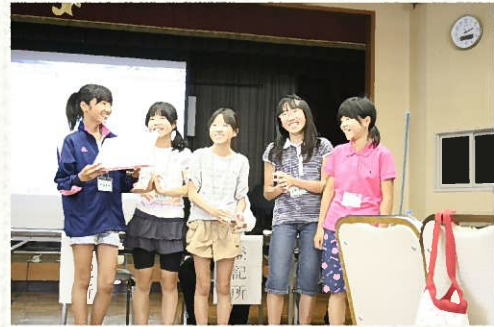
△セミナーの中で発表を行う小学生チーム

今後は、さらに2回セミナーを開催し、7月28日の七夕まつりで商品を販売し、結果を決算報告書にまとめて発表を行うこととなる。