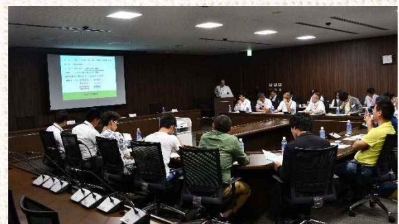
△平成29年度の例会の様子