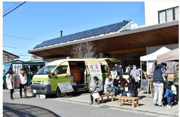
△エコ建築工房が行うイベントの様子

自社が実施しているCSR活動の一環で、市内で多発する空き巣被害に対して川柳で啓発を行ったことが新聞に取り上げられたが、この事業についてもプレスリリースセミナーで学んだことが生かされたとの事であった。