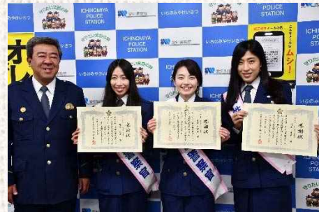
△感謝状を受け取る 一宮モーニングエンジェルス

4月9日、一宮モーニングプロジェクト参画店「ピットイン」にて、愛知県警の「～STOP！特殊詐欺～〇（まる）っとあいち・絆プロジェクト」の一環として防犯講話が行われ、一日女性警察官として「一宮モーニングエンジェルス」のメンバー3名が登場した。