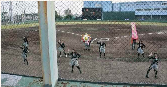
△会場で踊りを披露する 一宮モーニングエンジェルス

4月1日、平島公園野球場にて行われた女子プロ野球チーム「愛知ディオーネ」の一宮開幕戦に一宮モーニングのPR隊「一宮モーニングエンジェルス」が登場し、会場を盛り上げた。