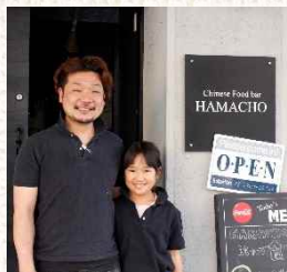
代表者佐竹氏と小学生の娘さん▲

メニューは、ホテル時代100品目以上を扱っており、当時名古屋や大阪から引抜かれて来た40名以上の先輩料理人から学んだ調理技術やこだわりを基に試行錯誤を重ね厳選した30品目を用意。