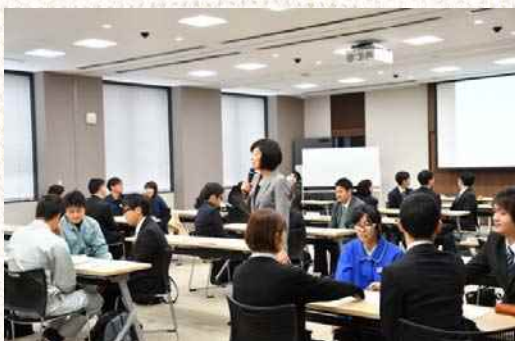
△ 4/17 セミナーの様子

新入社員が組織の中で定着し活躍するための基本姿勢やコミュニケーション方法を学ぶ「新入社員研修」を 2 日間に亘り開催し、40 社から 95 名の参加があった。