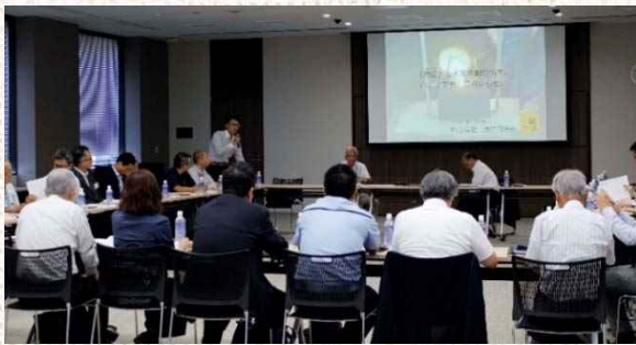
△平成29年度の例会の様子

本所では、新たなモノづくり産業の創出を図ることを目的に、新事業展開を模索する会員企業有志による「新産業創出研究会」（所管：産業振興委員会）を、いち信用金庫と共催で運営している。