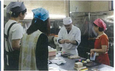
▲創作和菓子作りの様子

【まちゼミとは】平成 14 年、岡崎市の中心市街地から発祥。お店や企業の人々が講師となって、専門店ならではの知識や情報を原則無料で教えてもらえる少人数制のミニ講座。「得する街のゼミナール」を略して「まちゼミ」と言う。全国約 340 ヶ所で開催中。