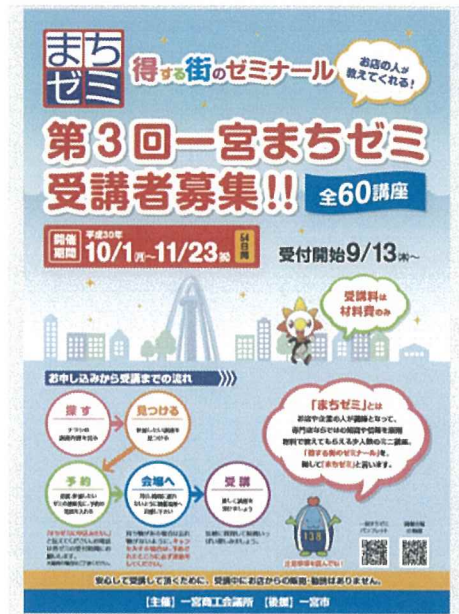
▲まちゼミのチラシ

今年度も個店の活性化（繁盛）と街の賑わい創りに貢献することを目的に「第 3 回一宮まちゼミ」を実施した。一宮市内の会員事業所 46 事業所が参加し、合計 60 講座を開催した。受講者アンケートの回答においては、 昨年度と比べ 53 名増となる 760 人以上の受講者から「楽しかった。」「勉強になり充実した時間だった。」と満足度 98%の嬉しい声が届いた。 また、まちゼミ終了後、講師を体験した店主や従業員が、 受講者にお礼状や割引券などを郵送するなど、次へのアクションを積極的に行っていた。 感想として「 練習を重ねた結果、前回より余裕を持って説明できた。 」、「 店の認知度が上がり信用に繋がった。 」などの声が寄せられた。