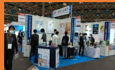
▲リアル展示会の様子