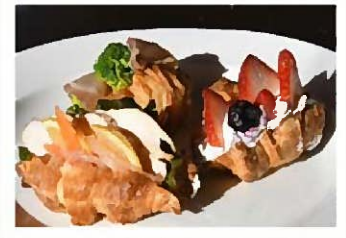
△ナチュラルビュッフェニューコーネ