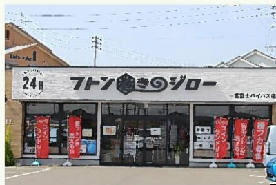
▲新規参入したFC事業

また、スタッフの発案でコインランドリー「フトン巻きのジロー」のFC事業に参入し、現在、一宮市、江南市などに