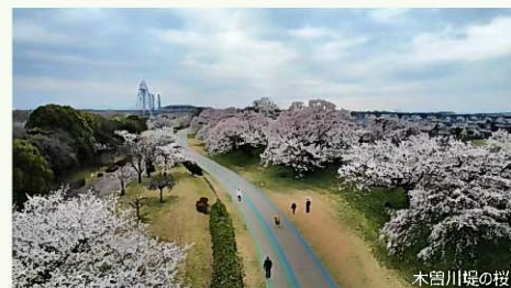
△木曾川堤の桜（ドローン撮影）