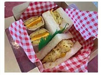
△鉄板お好み焼きカフェ STAGE