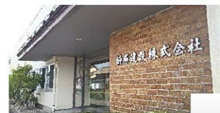
榊原建設株式会社