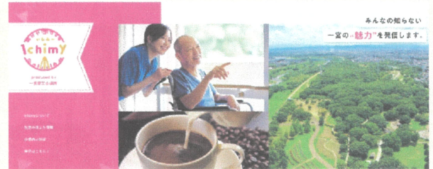
▲「Ichimy」サイトトップページ

本所が運営する動画まとめサイト「Ichimy」では、会員企業の皆様の PR 動画を随時募集しています。