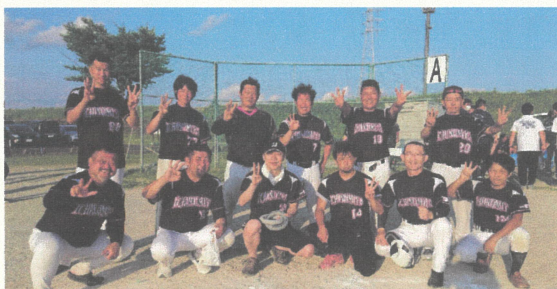
▲当日参加した青年部メンバー

当日は順調に勝ち進み接戦の結果、見事優勝を果たしました。本事業は、「当該年度に優勝した単会の市町にて次年度は開催する」といった慣例があるため、令和5年度は一宮市で開催を予定しています。