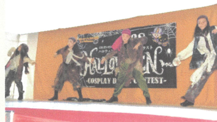
▲昨年のコンテストの様子