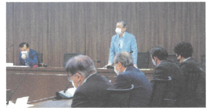
△挨拶をする光寄委員長

開催日：2022年6月7日 出席者：18名 議題：(1)2022年度 所管団体の事業概要について (2)2022年度 いちのみや観光プログラム事業概要について (3)その他