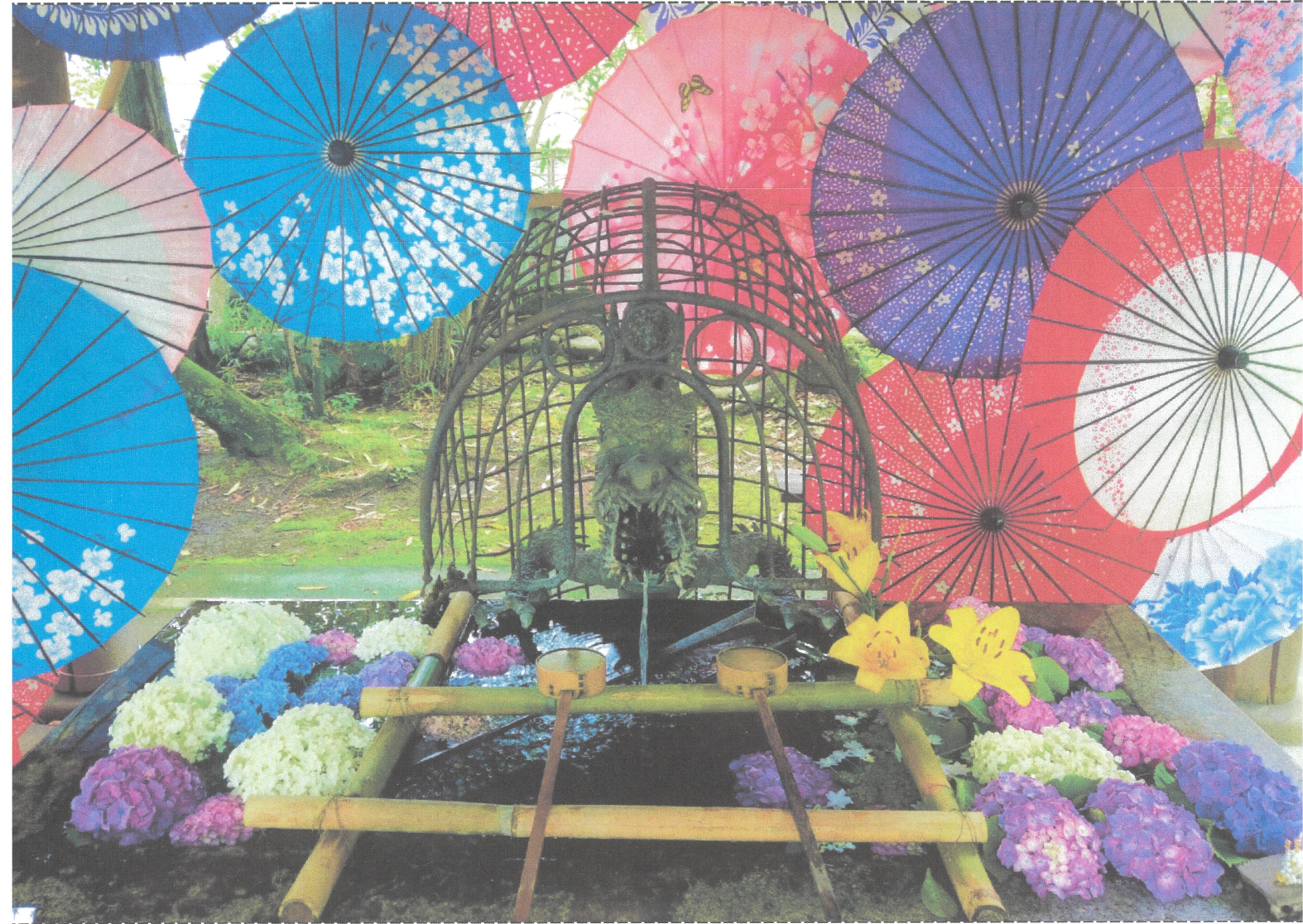
表紙写真 若宮神明社 手水舎