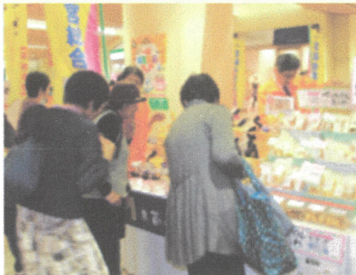
▲過去の食品フェアの様子