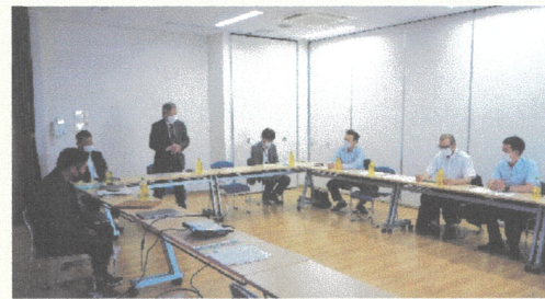
△萩原町連区関係者でのotta導入会議の様子(5/31)

記者会見には、中日新聞社、中部経済新聞社、アイ・シー・シーなど多くのメディアの記者にお集まりいただきました。