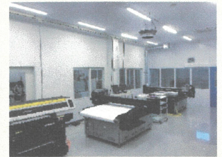
▲2019年に竣工した新社屋(左)と印刷室(右)