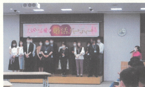
▲婚活イベントの様子