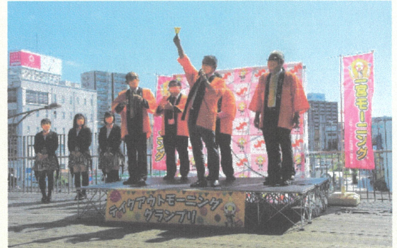
△イベント当日の様子