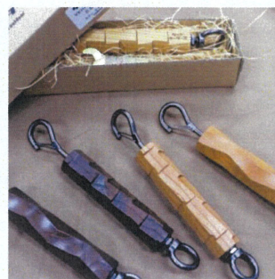
▲ビーグルハンガー