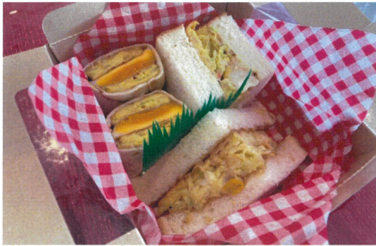
△お好み焼きサンドセット