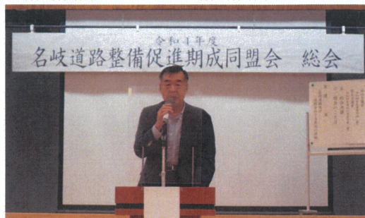
▲挨拶をする豊島会頭