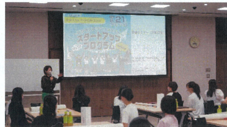
▲事前セミナー（出張授業）の様子

7/9に開催した事前セミナー（出張授業）では、コンテストに参加する高校生のキックオフとして、身近な課題と解決アイデアの創出からビジネスモデルへの発展までワーク形式で学び、3分間の発表までを行いました。コンテストへの参加は3校合わせて14チームを予定しており、1次審査を通過したチームが本選でピッチを行います。