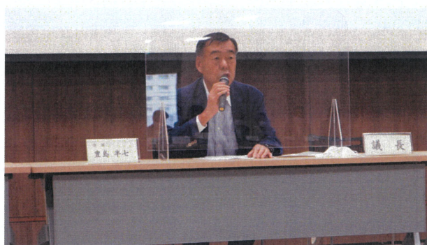
▲挨拶をする豊島会頭

豊島会頭は冒頭で、「一宮七夕まつりが、3年ぶりに正規に近い規模で開催予定であり、7月28日のオープニングセレモニーを皮切りに、31日には本所開催の『一宮コスプレ Real Live ランウェイ』と『一宮七夕飾りをバックに写真を撮ろう』が開催されます。また、『国際芸術祭あいち 2022』も7月30日から10月10日まで開催され、一宮市も会場となっておりますので是非、参加をお願いします。」と挨拶がありました。