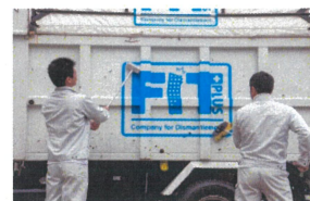
株式会社フィット