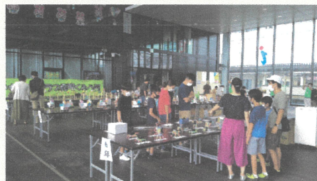
▲当日の会場の様子

当日は台風14号の接近に伴い、13時30分で中止となりましたが、376名の方にご来場いただきました。