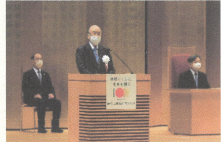
▲当日の記念式典の様子