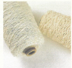
▲ネットヤーン 結び目状の玉ができる糸

性・快適性を求めた機能繊維の「ヒノキコットン繊維」や、マイナスイオンを発生する「C・P・Eマイナスイオン繊維」など、オリジナルの糸を作り出すアイデアと技術を誇り、引き合いも絶えません。