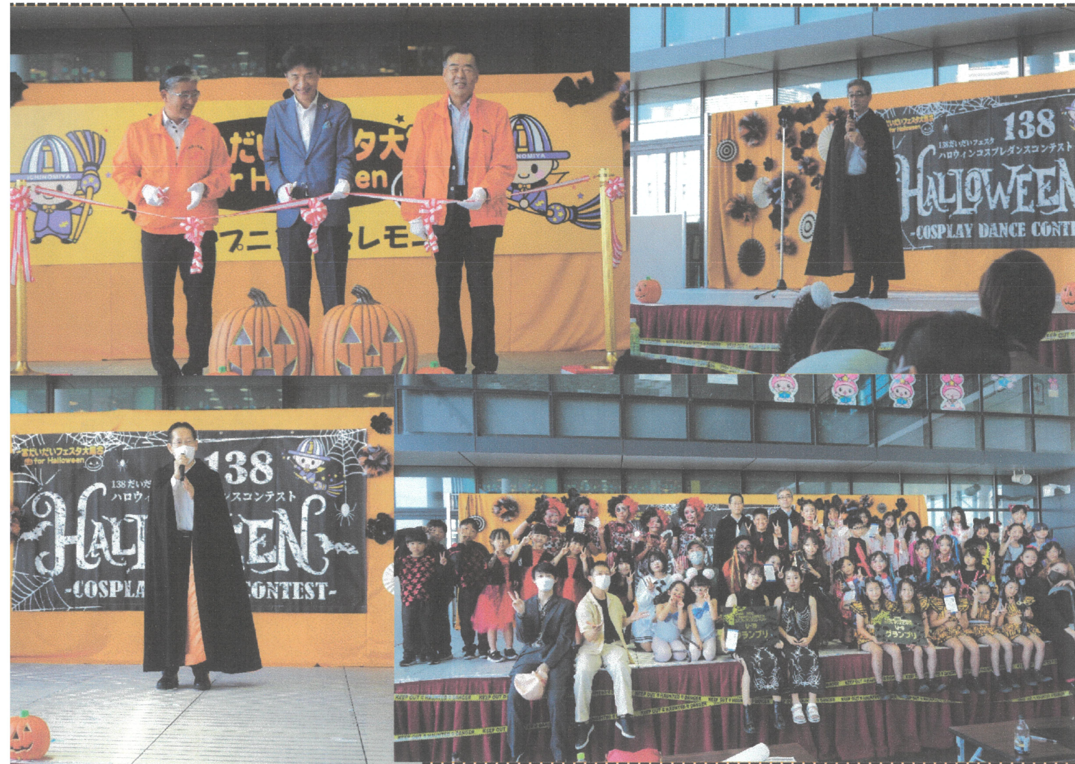
表紙写真 一宮だいたいフェスタ大集合 for Halloween 2022 オープニングセレモニー 138 ハロウィンコスプレダンスコンテスト