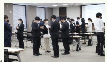
▲実践形式の名刺交換