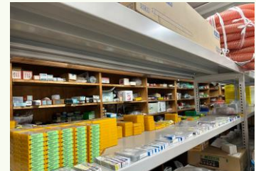
▲整理・確保された在庫

「お客様の依頼は断らない」をモットーにしている当社は、80 社程ある仕入れ先の伝手を活用し、依頼された部材をかき集め納品し