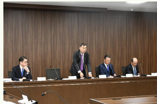
▲挨拶をする豊島会頭