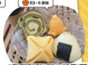
JA豊田西産直広域南小浜店パン工房 おこめパン屋さん 一宮おこめモーニング

パンの器に入ったオニオンバターライ スに、クリームシチューとモッツアレ ラチーズをのせて販売します。温めて (焼いて)お召し上がりください。