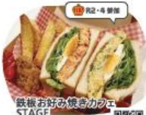
鉄板お好み焼きカフェ STAGE お好み焼きサンド (スキサン)セット

ワッフルでサンドイッチを挟んだ おかず系サンドイッチです。甘じょっぱい ワッフルとの相性は抜群! ポテトフライ、キャベツマリネ、人参ソ テーも華やかです。