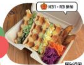
cafe merneige ワッフルサンドBOX

地元のお米と卵を使ったJAならではの 地産地消メニューです。 つくたてのお米で作った米粉おにぎり パンや米粉スイーツは、まさに絶品!