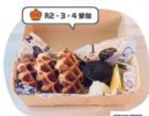
オリーブの木 クロワッサンモーニング

クロワッサン生地をワッフルケーキで 一つ一つ丁寧に焼き上げました。 新食感クロワッサンをご賞味ください。