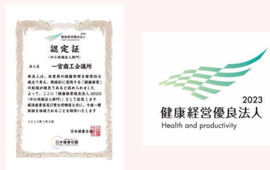
▲認定証と認定マーク

経済産業省が制度化し、日本健康会議が認定する「健康経営優良人2023」に本所が認定され、2020年から4年連続の認定取得となりました。