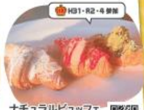
ナチュラルビュッフェ ユコーネ 映えチョコクロワッサン

ユコーネ人気のクロワッサンを抹茶、 ホワイトチョコ、ストロベリーチョコの 3つの味で楽しめます。