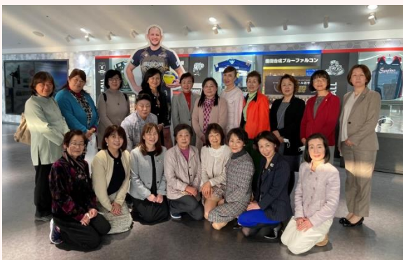
▲稲沢商工会議所女性会の皆さんと ENTRIO にて

稲沢9名、一宮13名が参加し、ENTRIO内のアンドトレッセにてデザートプレートをいただきながら、お互いの活動報告や各会員が自己紹介をしました。さらにアリーナにてバレーボールチーム ウルフドックスの迫力満点の練習を見学し、親睦を深めました。最後にお互いの発展を願いつつ、再会を約束しました。