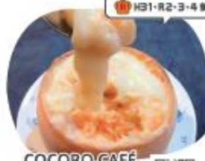
COCORO CAFE パンの器の クリームドリア

自家製漬野菜を使ったサンドイッチと手作りパ ン。そのまま食べても、お好みでサラダや チキンを挟んでも、フルーツサンドにしても 絶品です!幸せが詰まったBOXです。