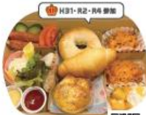
シェ・サン マカン☆マカン

クロワッサン生地をワッフルケーキで 一つ一つ丁寧に焼き上げました。 新食感クロワッサンをご賞味ください。