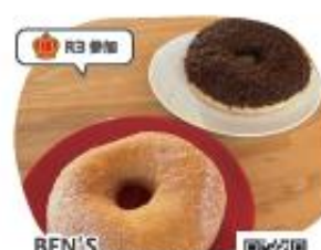
BEN'S MORNING CAFE ふわもちドーナツ

パンにお好み焼きをサンドするのが当店 の鉄板メニューです。カフェならではの SOGs食材を多用し、コストダウンとボ リュームアップをしました。お好み焼きサ ンドは是非「スキサン」と呼んで下さい。