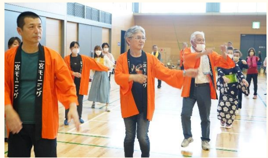
▲レクリエーション教室「盆踊り講習」の様子(6/17)