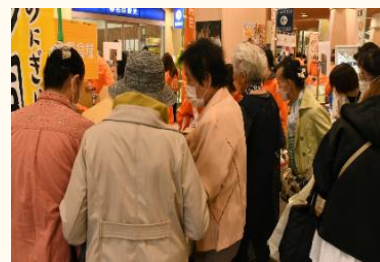
▲過去の食品フェアの様子

【問合せ】第42回一宮総合食品フェア事務局 (一宮商工会議所内) ☎：72-4611