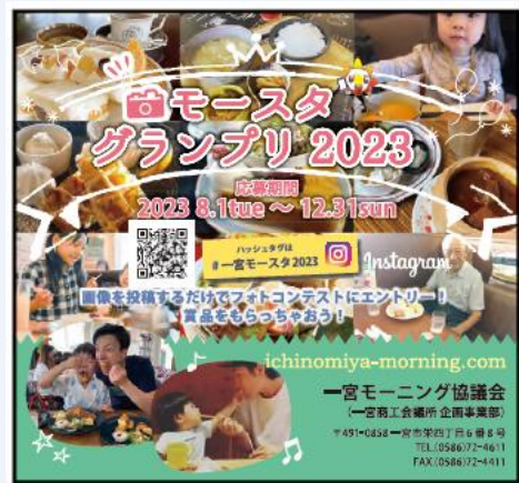
△モースタグランプリチラシ