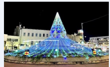
▲ 今年の装飾の様子

現在、企業様からのご協賛をお願いしています。冬の一宮の振興にご支援賜ります様、よろしくお願い致します。