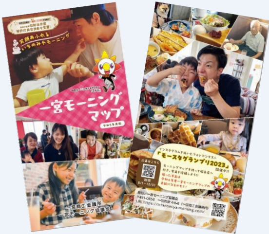
△新たに発刊するマップ

各店舗のページでは、所在地や店内の雰囲気、提供されるメニューのジャンル等を紹介しています。これまで以上に一宮モーニングの魅力を伝える一冊となりました。お手にとって一宮モーニングを提供する喫茶店を巡ってみてはいかがでしょうか。