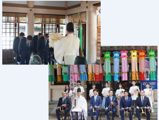
▲祈願祭当日の様子

祈願祭は、一宮七夕まつりの成功と安全を祈るため、毎年7月7日に開催しており、当日は中野一宮市長、豊島会頭ら関係者6名と、学生サポーター7名が出席しました。