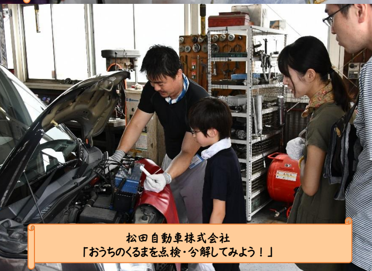
松田自動車株式会社 「おうちのくるまを点検・分解してみよう!」