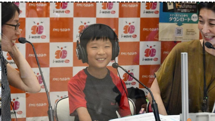
FMIいちのみや株式会社 「パーソナリティ体験」