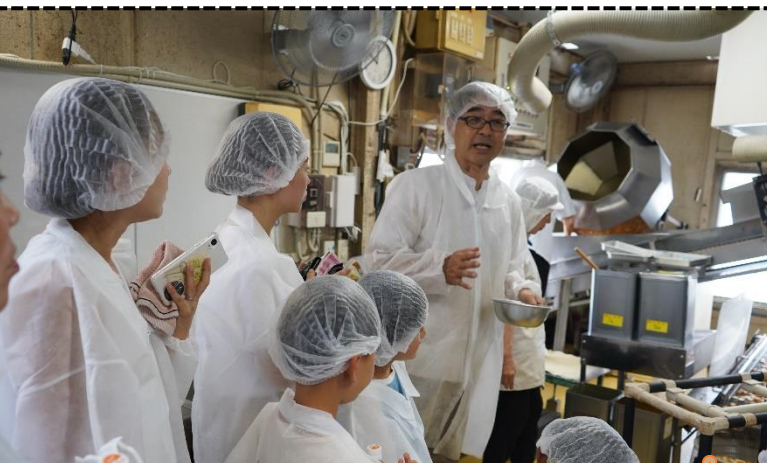
菊一あられ株式会社 「お米のおかし「あられ」の工場を探検してみよう」