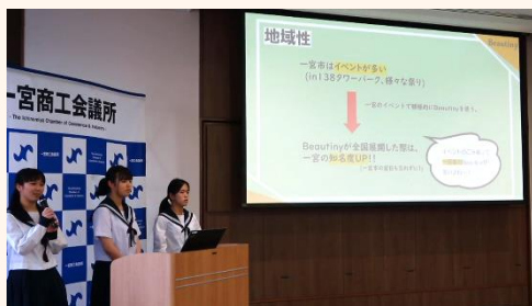
△一商「Beautiny」ピッチの様子