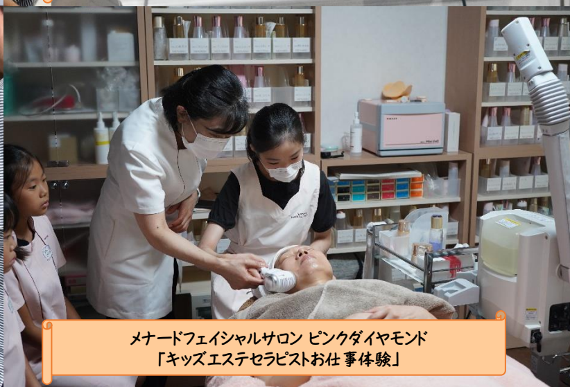
メナードフェイシャルサロン ピンクダイヤモンド 「キッズエステセラピストお仕事体験」

P3 TGC 地方創生プロジェクト 「BISHU COLLECTION produced by TGC」が開催決定!