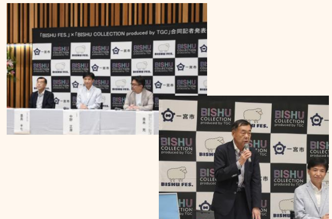
▲記者発表会の様子

豊島会頭は「尾州は毛織物の一大産地。若い世代の方々にも尾州織物の知名度がより広まる事を期待しております。そして、当日のおもてなしにも最善を尽くしたい」と述べられました。