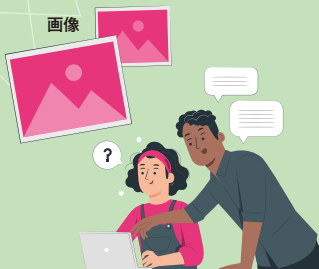
テロップ用の原稿