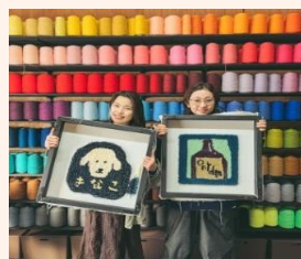
▲タフティング教室での作品

BtoBからBtoCへの販路拡大を模索する中で、1束でもかせ染めができる染色機も考案して特許を取得。素材や色を指定して少量でも注文できる“色系パレット”を販