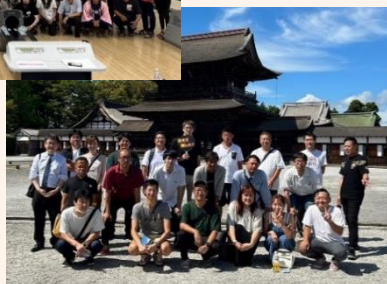
▲稲沢(左)・高岡(右)両青年部との交流事業の様子