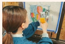
▲タフティングの様子

そのような中、同時期日本では馴染みのなかった、針のついた銃のような「タフティングガン」を使って布に手芸糸を打ち込む織物技法「タフティング」に目をつけます。タフティ