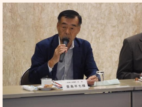
▲事業の説明をする豊島会頭

会議では、来たる11月1日に開催予定の県連会頭会議における西尾張ブロックからの要望内容の確認とともに、各会議所からのトピックス紹介などが行われました。