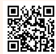
▲公式ホームページ

上記記載事項は9月21日時点における開催概要となります。本イベントの開催詳細や追加される情報につきましては、『BISHU COLLECTION produced by TGC』の公式ホームページでご確認ください。