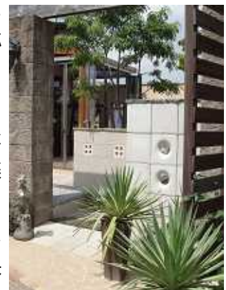
情報館リニューアル