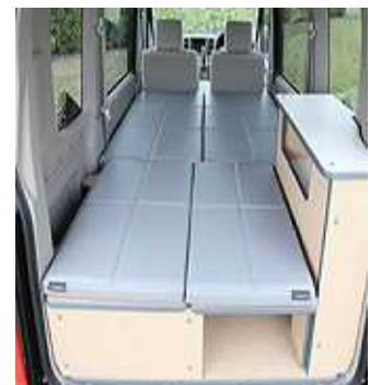
キャンピングカー 車内